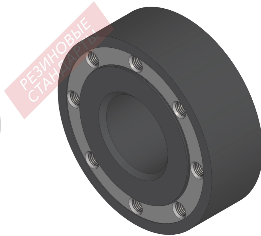
Таблица 2 - параметры